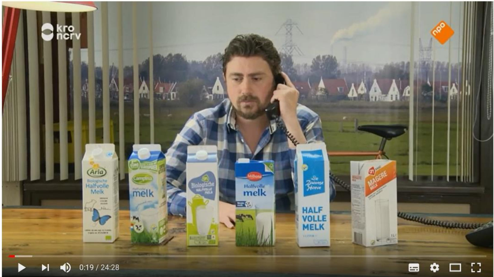
Keuringsdienst van Waarde - Melk

https://www.youtube.com/watch?v=OJUF3Ikq_b0Q